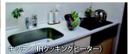
キッチン(IHクッキングヒーター)

今回は先着受付にて、家具付でモデルルーム(44㎡/広々リビング17帖)をご紹介致します。1室限定ですので、お早めにお問い合わせください。