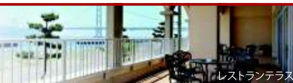
レストランテラス