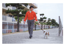
愛犬とともに住まいいただけます (管理規程に基づきます)